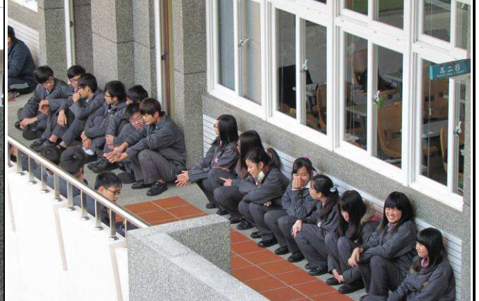
在教室走廊成 2-4 排(女前男後)，背對教室坐(蹲)下(以能走動為原則)。