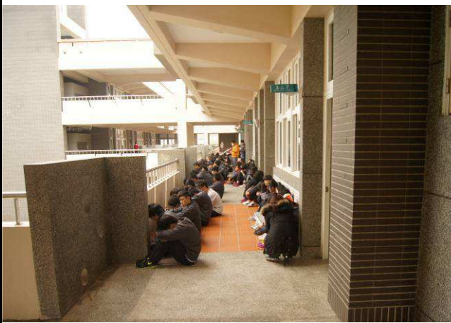
在教室走廊成 2-4 排(女前男後)，背對教室坐(蹲)下(以能走動為原則)。