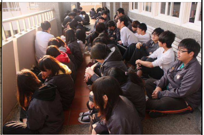
在教室走廊成 2-4 排(女前男後)，背對教室坐(蹲)下(以能走動為原則)。