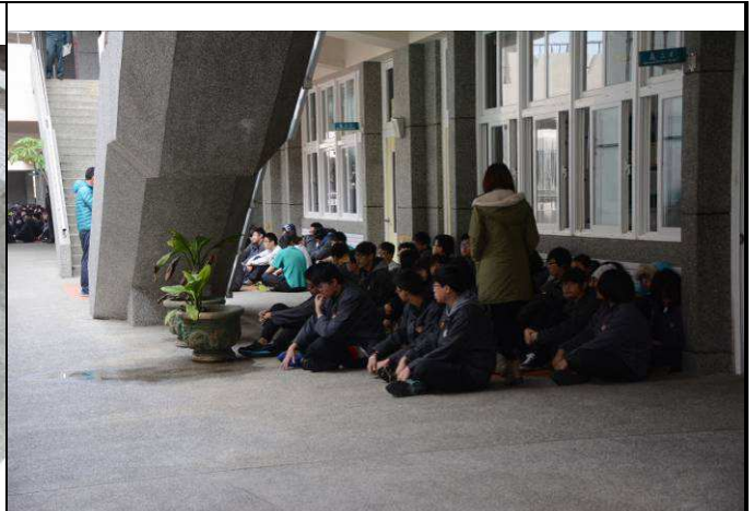
在教室走廊成 2-4 排(女前男後)，背對教室坐(蹲)下(以能走動為原則)。