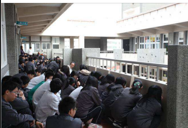
在教室走廊成 2-4 排(女前男後)，背對教室坐(蹲)下(以能走動為原則)。