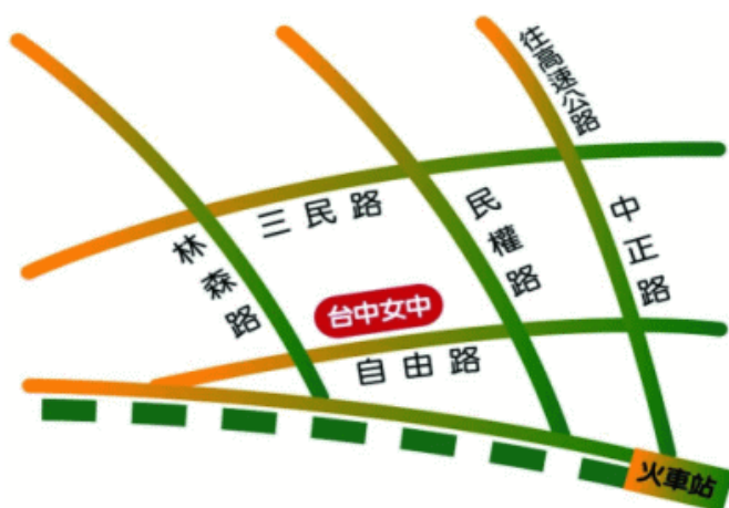
臺中市立臺中女子高級中等學校 110 學年度校園配置圖

※校內不開放停車，請搭乘大眾運輸工具到校。若有需開車至該校之老師，請將車輛停放至鄰近該校之平面停車場或週邊道路停車格。