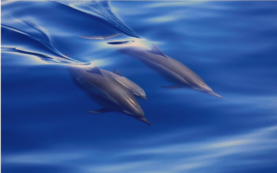
飛旋海豚。