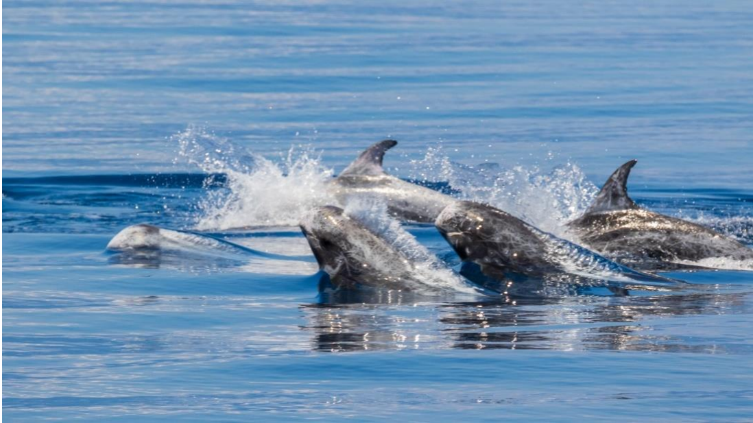
花紋海豚。