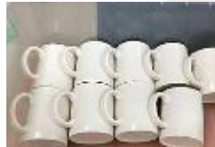
提供環保餐具盛裝