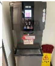
設置飲水機或桶裝水