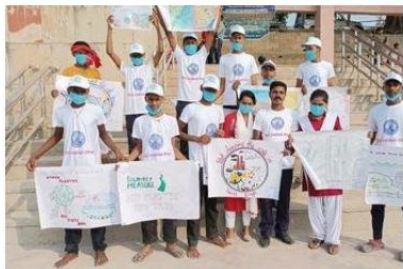
20 Dec 2021