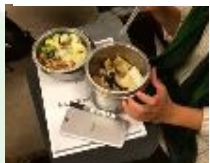
以可重複清洗餐具供餐