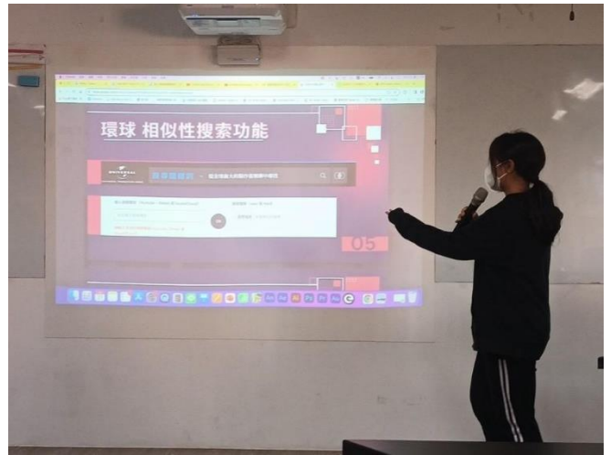
學生成果作品分享