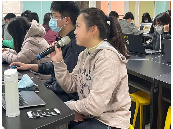
學生初次使用ChatGPT分享