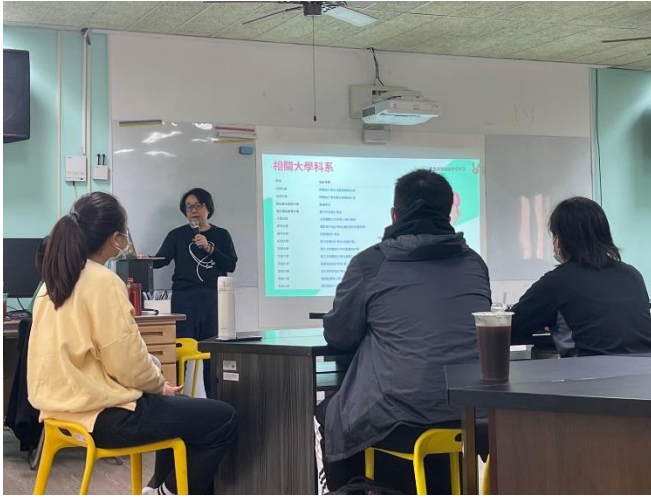
溫璿縵老師自我介紹