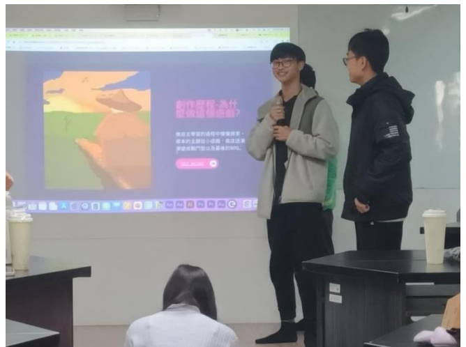
學生作品分享(ChatGPT & Canve)