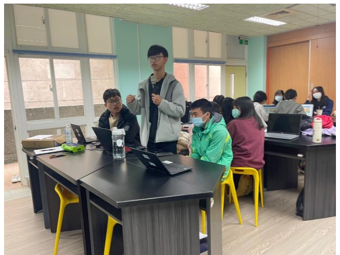
學生初次使用ChatGPT分享