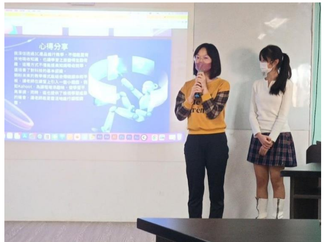
學生成果作品分享