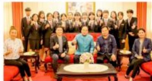
南應大旅館系執行教育部長劉育奇與系上教師及學生合影。