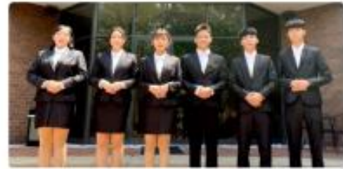
南應大旅館系六生赴美實習，體驗海外職場生活，並與美國旅館進行全英語面試。