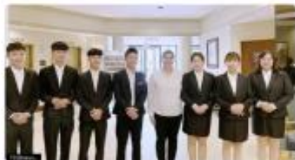
南應大旅館管理系率領學生赴美實習，讓學生充分體驗海外職場生活。（記者李麗祥攝）

▲南應大旅館管理系率領學生赴美實習，讓學生充分體驗海外職場生活。（記者李麗祥攝）