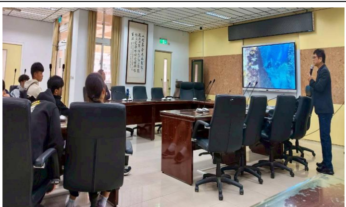
教授說明台東大學獨有的學習優勢及資源