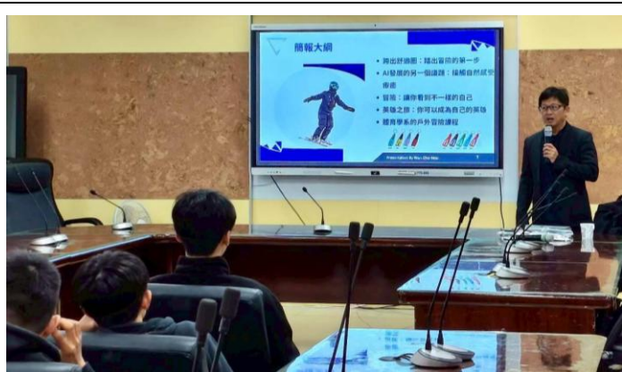
教授說明冒險教育的內涵及實際的教學應用