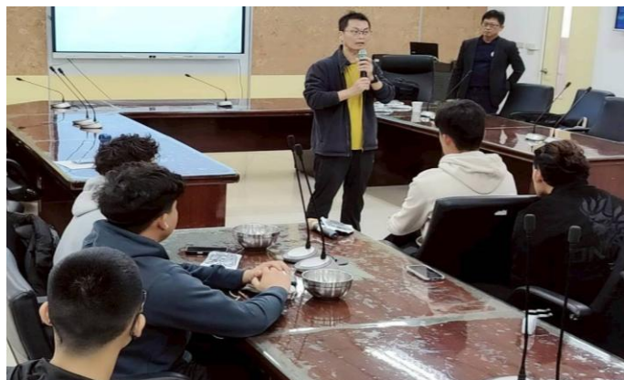
講座結束前輔導主任致感謝詞