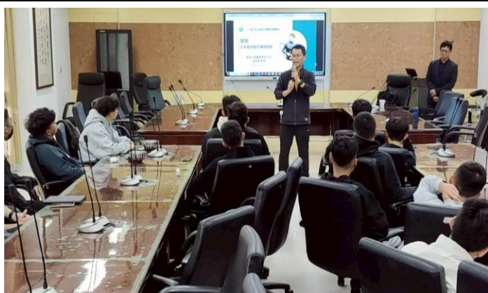
講座結束前輔導主任開場致歡迎詞