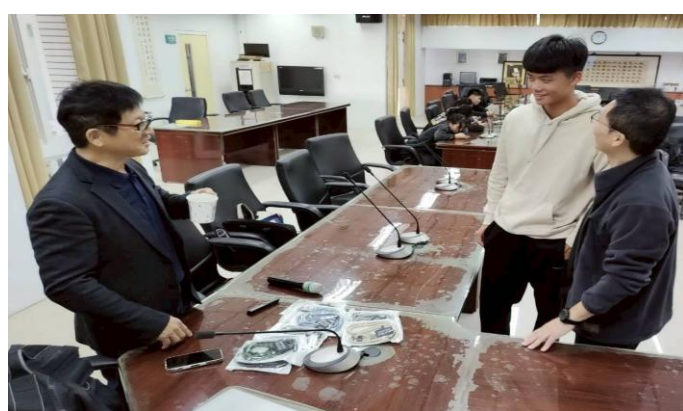
講座結束時學生請益的師生互動