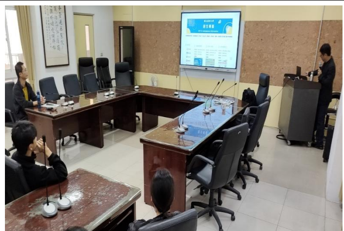
教授說明多元入學升學管道