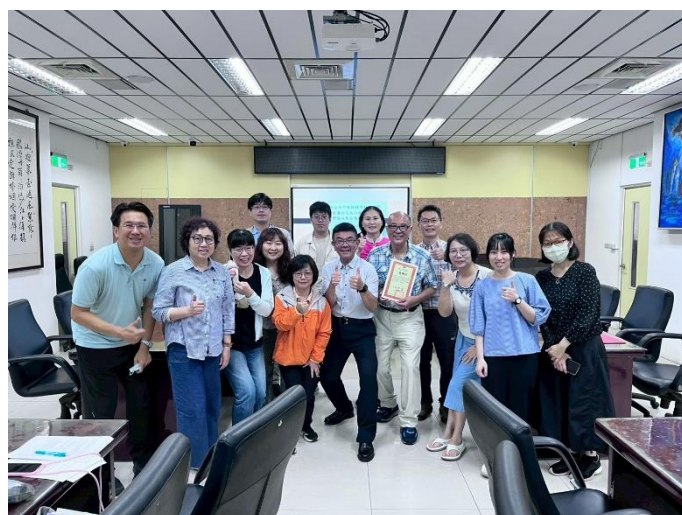
參與教師成員大合照