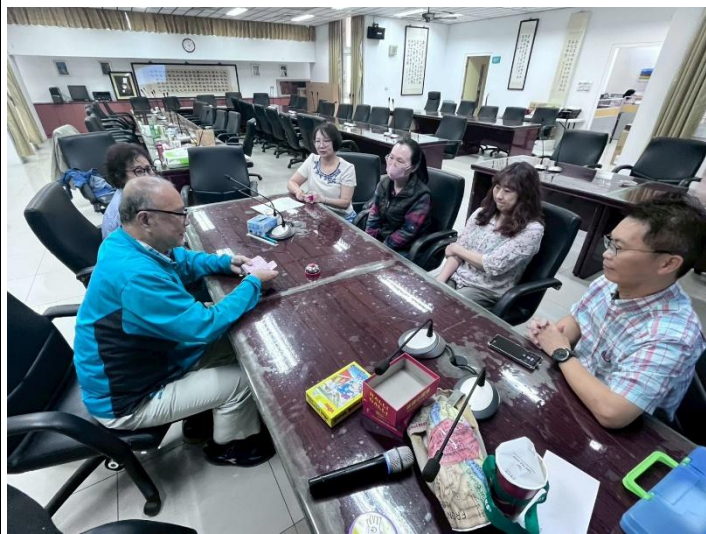
透過桌遊練習帶領學生團體活動