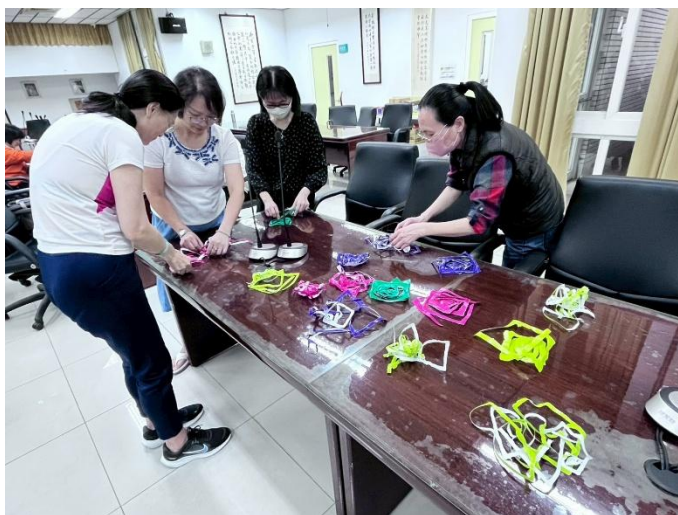
撕紙靜心與專注活動