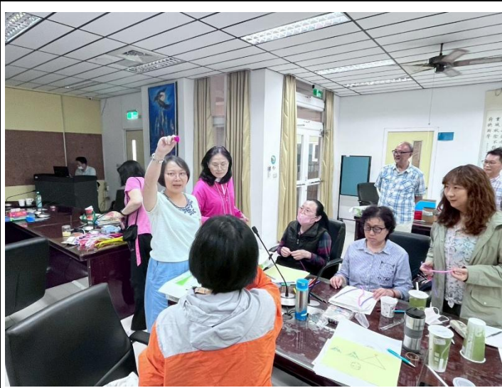
製作團體活動象徵物