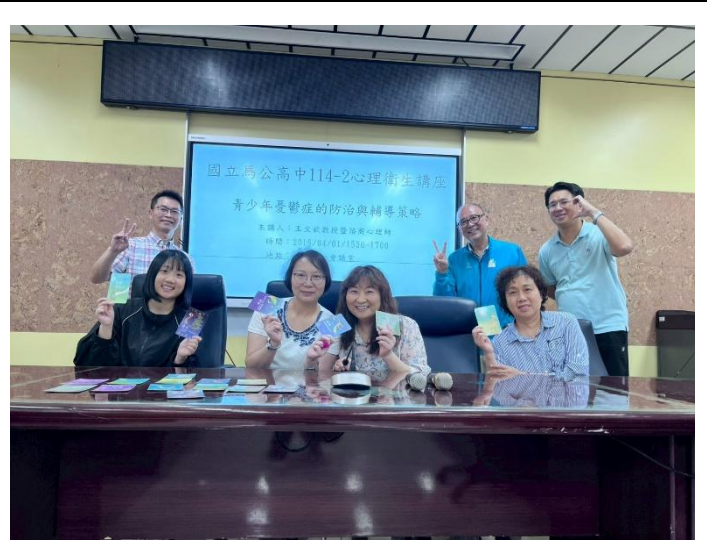
青少年憂鬱輔導策略學習