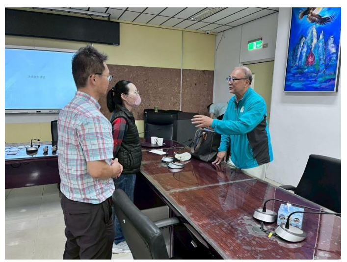
教師向講師諮詢青少年心理議題