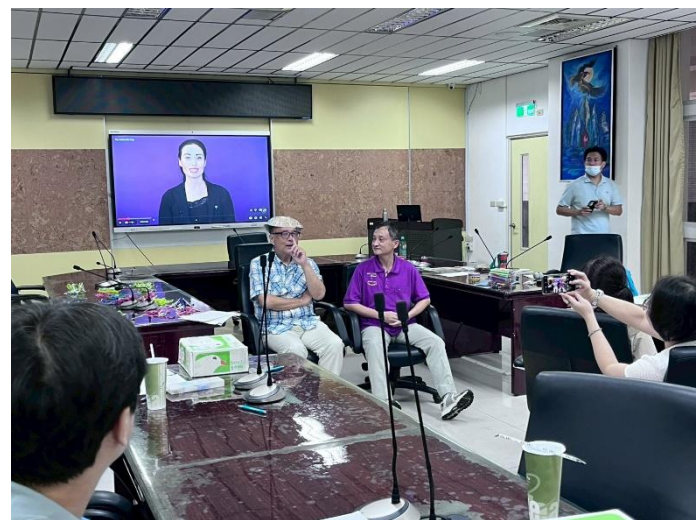
練習蝴蝶抱抱活動