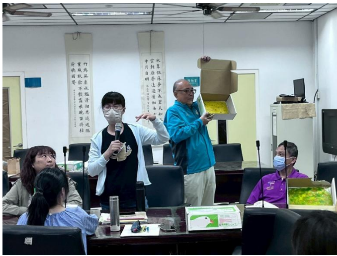
透過藝術彈珠畫覺察自我