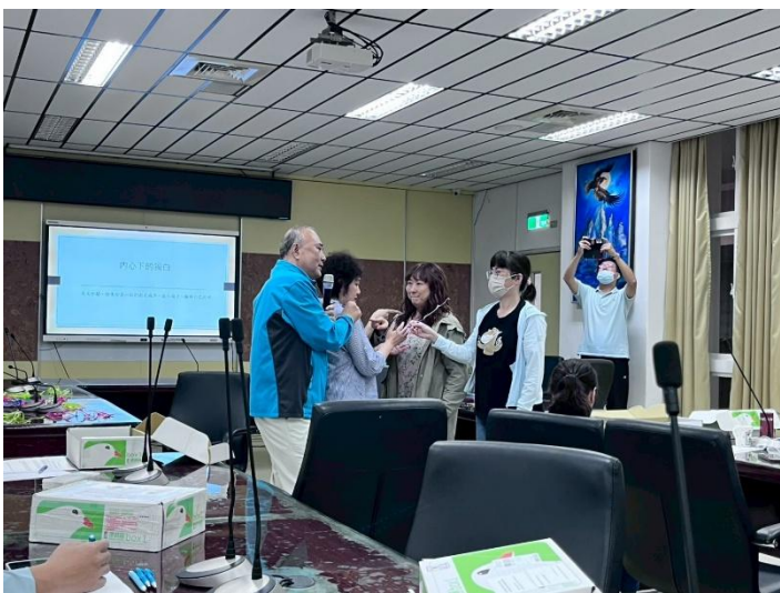
薩提爾身體雕塑活動