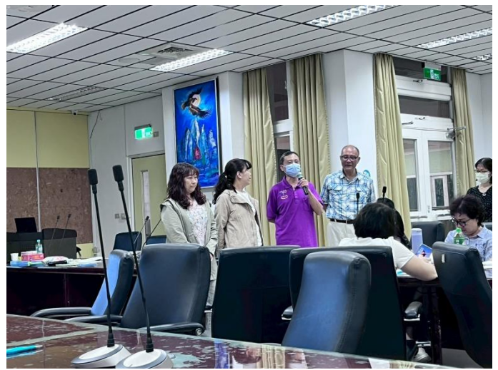
成員分享出生序對自我影響